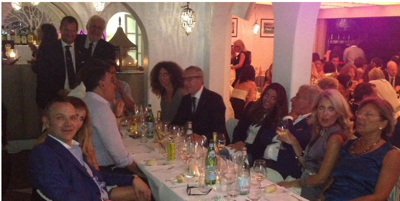
Foto di gruppo che ritrae una parte dei nostri soci presenti alla serata