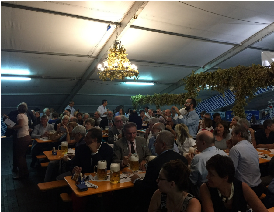
Un'immagine della serata

Tendone Oktoberfest Piazza della Vittoria